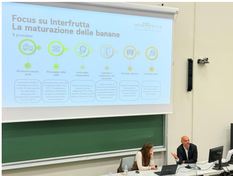
Figura 7: Foto Seminario Talk about "Dole" 1/3