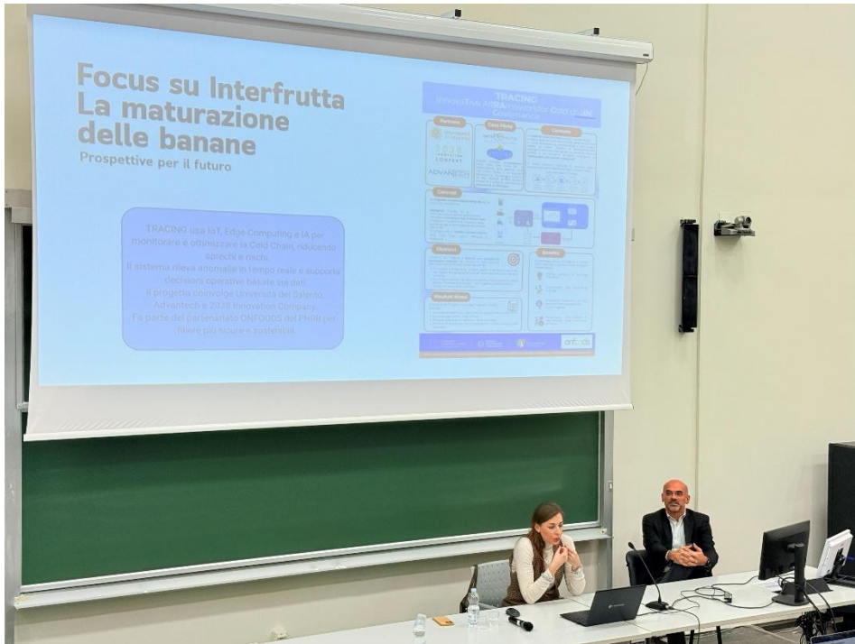
Figura 9: Foto Seminario Talk about "Dole" 3/3