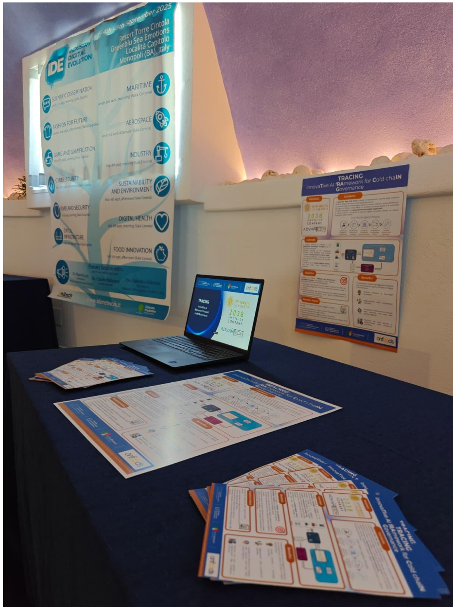
Figura 1: Foto evento IDE 1/2

Il progetto è stato presentato all'IDE, INDUSTRY DIGITAL EVOLUTION, conferenza dedicata all'evoluzione digitale dell'industria, che si è svolta presso Torre Cintola Greenblu Resort, Capitolo, Monopoli (BA), dal 03-05 Settembre 2025.