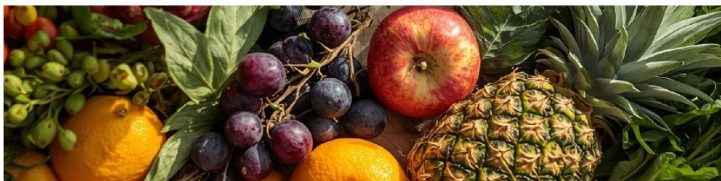
Figura 5: Slide Seminario Talk about "Dole" 1/2