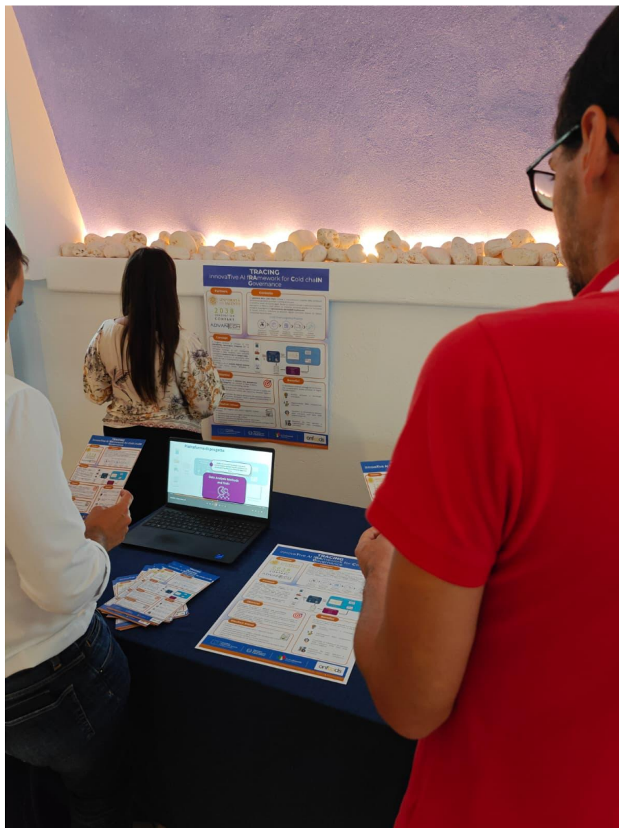
Figura 2: Foto evento IDE 2/2